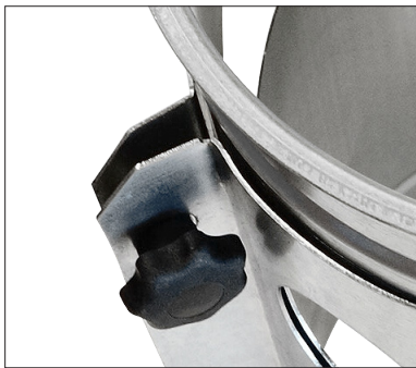
Système de fermeture avec boutons étoile.