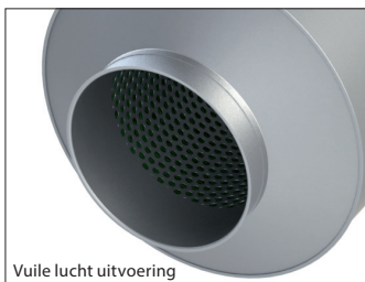
Vuile lucht uitvoering